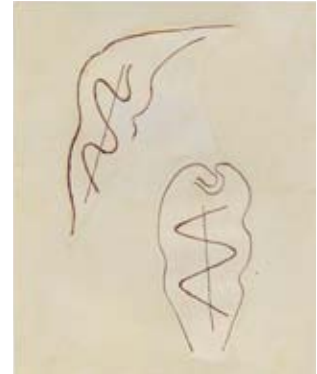
Rudolf Steiner, Signetentwurf für Weleda, 1922/23 Rudolf Steiner Archiv, Dornach