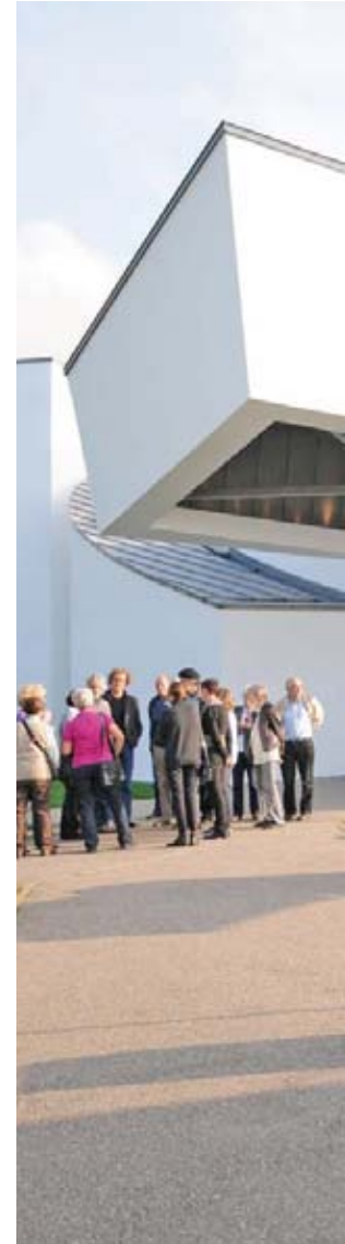
Architekturführung, Vitra Design Museum