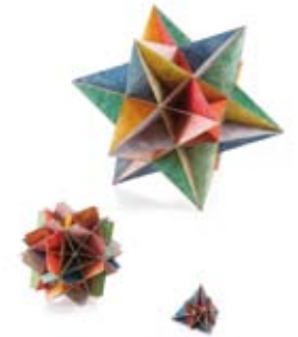
Carl Kemper, Platonische Körper, farbig gefasst, Karton, 1930er Jahre Rudolf Steiner Archiv, Dornach, Foto: Andreas Sütterlin

Einführung in die Eurythmie mit der Künstlerin Tara John, auf der Violine begleitet durch Sarah Kazakov. 20,- € / erm. 10,- € pro Person Anmeldung unter workshops@design-museum.de