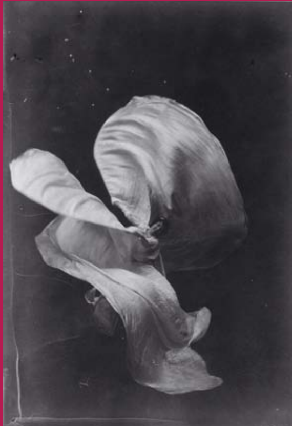
Die Tänzerin Loie Fuller, 1897

Lors de quatre soirées, des performances artistiques se mêlent à des expériences culturelles et culinaires inédites. Laissez-vous surprendre !