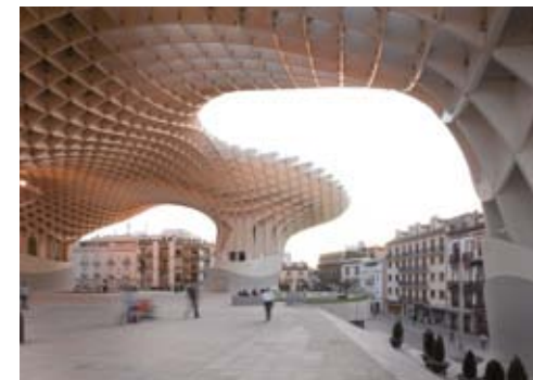
Metropol Parasol, Sevilla © Jürgen Mayer H.