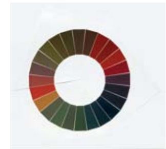
Olafur Eliasson, The Double Constant Colour Circle , 2008 Collection Alexander von Vegesack