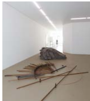
Werke von Joseph Beuys im Museum für Gegenwartskunst Basel