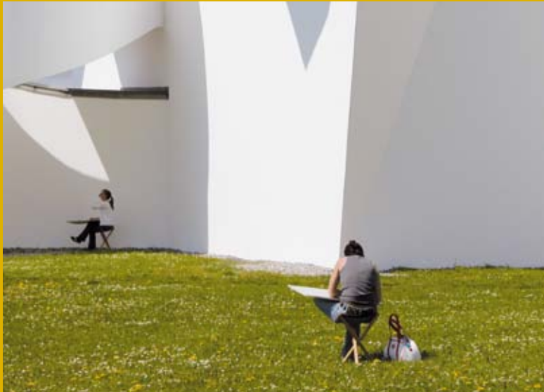
Workshopteilnehmerinnen vor dem Vitra Design Museum

Parallèlement à l'exposition, le Vitra Design Museum propose des ateliers pour toutes les tranches d'âge et organise de façon régulière des ateliers pour écoliers qui reprennent les grands thèmes de l'exposition.