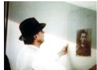
Joseph Beuys in Betrachtung eines Portraits von Rudolf Steiner, 1973