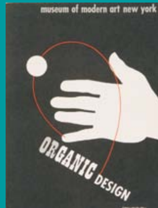
Ausstellungskatalog Organic Design des Museum of Modern Art, New York, 1941 Collection Alexander von Vegesack Foto: Andreas Sütterlin

Designer Werner Aisslinger im Gespräch mit Volker Albus, Hochschule für Gestaltung Karlsruhe, über Nachhaltigkeit, Design und die grüne Revolution.