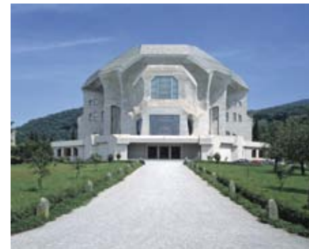
Westfassade des zweiten Goetheanums

initiatives de Steiner. Autour de l'exposition « Rudolf Steiner – L'Alchimie du Quotidien », le Vitra Design Museum a conçu un grand programme de manifestations spéciales, offrant la possibilité d'explorer la région sur les traces de Steiner, de critiquer ou approfondir des sujets de l'exposition, ainsi que de rechercher énorme influence de Steiner sur le design, l'architecture et la société d'aujourd'hui.