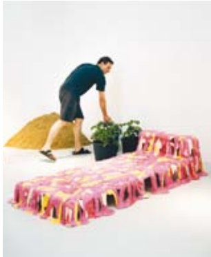
Jerszy Seymour bei einer Installation zur Ausstellung „MyHome – Sieben Experimente für ein neues Wohnen“ im Vitra Design Museum Juni 2007