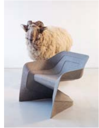
Hemp Chair, Studio Aisslinger