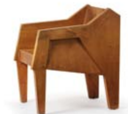
Hermann Ranzenberger, Armlehnstuhl, um 1935 Kunstsammlung Goetheanum