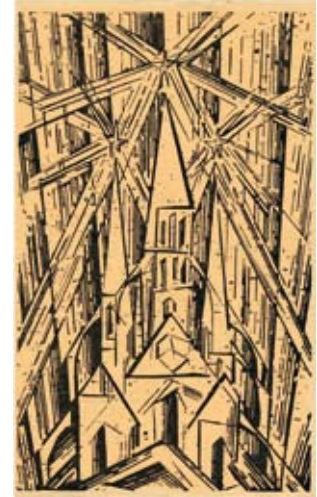
Lyonel Feininger, Titelbild für das Manifest und Programm des Staatlichen Bauhauses, April 1919 Bauhaus-Archiv Berlin