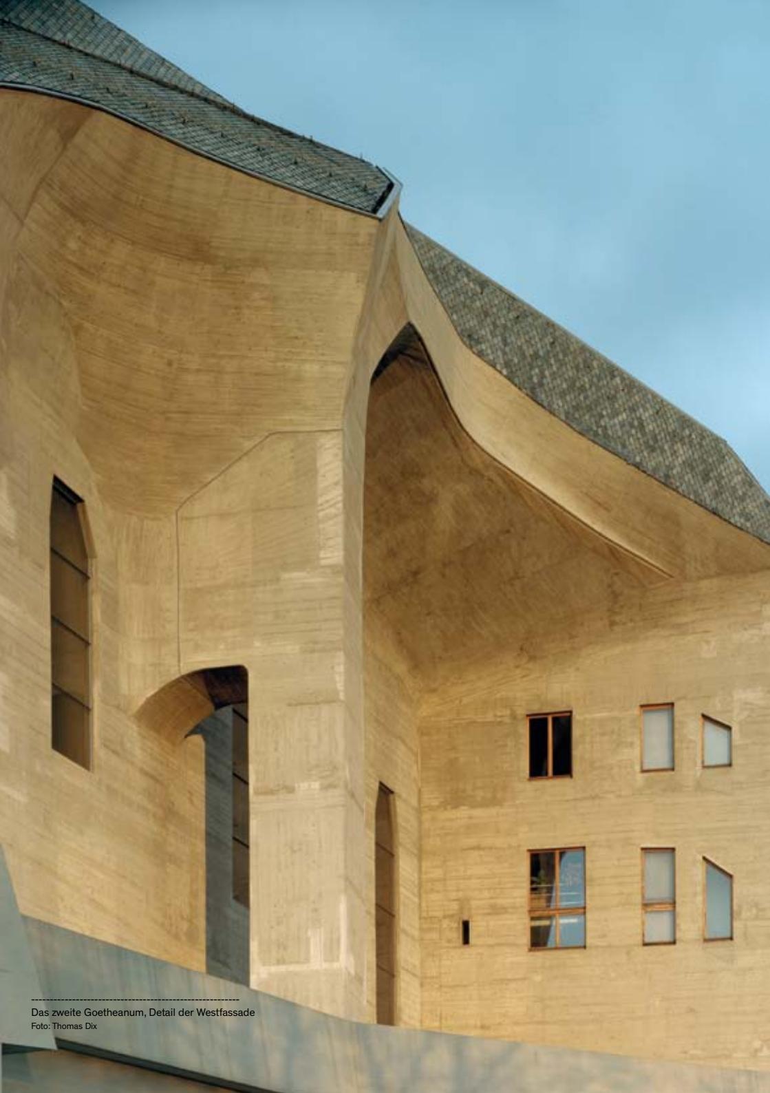
Das zweite Goetheanum, Detail der Westfassade