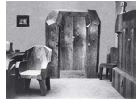
Oswald Dubach (zugeschrieben), Zimmereinrichtung im anthroposophischen Stil, um 1935