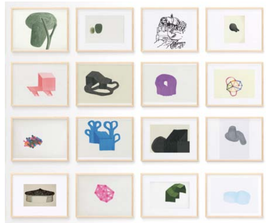
Ronan und Erwan Bouroullec – Album Exhibition, 2011 – Detail © studio Bouroullec

Die Brüder Ronan und Erwan Bouroullec zählen zu den einflussreichsten Designern der Gegenwart. Ihre Entwürfe sind vielfach inspiriert von Formen und Strukturen der Natur. Die Ausstellung präsentiert Entwurfzeichnungen der Bouroullecs und lenkt den Blick auf das Medium Zeichnung, das auch im Zeitalter des Computers nicht an Bedeutung verloren hat. Sie bietet faszinierende Einblicke in den Entstehungsprozess einzelner Objekte sowie in die Inspirationswelt der Designer.