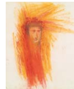
Rudolf Steiner, Kentaurenkopf, Farbstudie für die Kuppelmalerei des ersten Goetheanums 1917/18