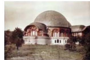
Das erste Goetheanum, 1913–22

S AM, Schweizerisches Architekturmuseum, Steinenberg 7, CH-4051 Basel, www.sam-basel.org Öffnungszeiten: Di, Mi, Fr 11–18 Uhr, Do 11–20:30, Sa, So 11–17 Uhr -----