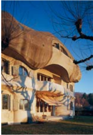
Haus Duldeck, Westfassade © Roland Halbe