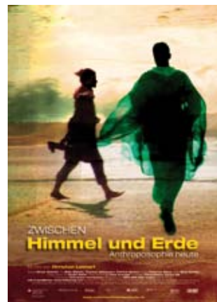
Filmplakat „Zwischen Himmel und Erde“