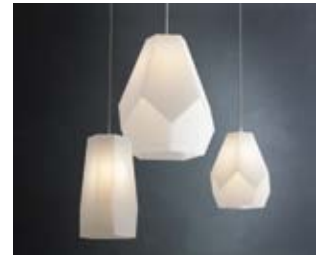
Rudolf Dörfner/Artolux, Pendelleuchten aus Acrylglas, hergestellt seit den 1970er Jahren Rudolf Dörfner/Artolux, Foto: Andreas Sütterlin