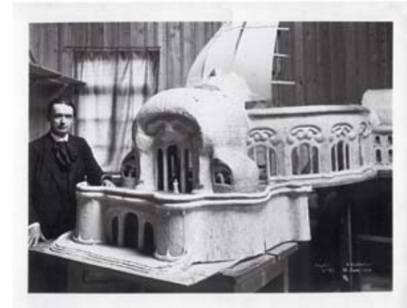
Rudolf Steiner mit einem Modell des ersten Goetheanums, 16. Juni 1914 (BSL 1023 10)