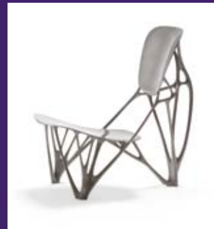
Joris Laarman, Bone Chair, 2006

Heures d'ouverture: Lun–Dim 10–18 heures